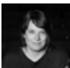
Katharina Riedler

Jeder Mensch sammelt individuelle Erfahrungen beim Aufwachsen, im Privatleben und auch im beruflichen Kontext. Diese sind unter anderem davon geprägt, in welchen gesellschaftlichen Bereichen wir Diskriminierung erleben oder Privilegien erfahren. Sie bestimmen die eigene Perspektive auf ex- oder inkludierende Strukturen sowie die Möglichkeit zu unterschiedlichen Formen der Partizipation.