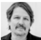
Hannes Salat © Judith Stehlik